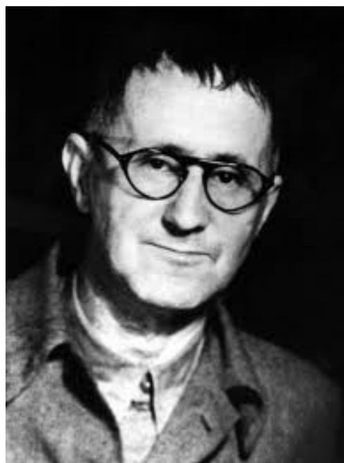
ترجمه یحیی سمندر